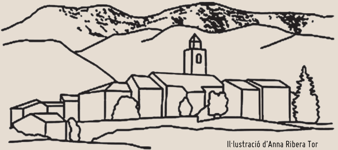
Il·lustració d'Anna Ribera Tor